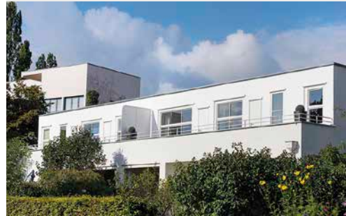
Stuttgart, Weißenhofsiedlung oben: Haus J. J. P. Oud unten: Haus Josef Frank