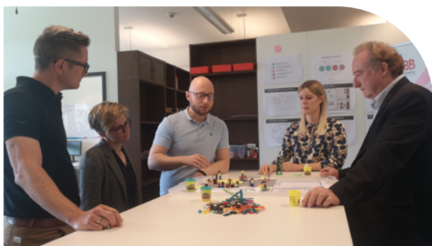
Lab mit Unternehmern organisiert vom Digitransprojekt

Eine bessere Governance in Bezug auf die Zusammenarbeit und mehr Sicherheit in Europa