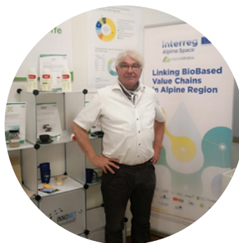
Produktausstellung des AlpLinkBioEco Projektes

Das AlpBioEco Projekt hat verschiedene Produkte aus Heu, Äpfeln und Walnüssen entwickelt.