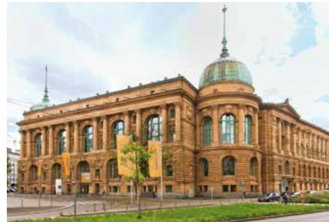
Haus der Wirtschaft Baden-Württemberg

Für Besucherinnen und Besucher mit Sehbehinderung sind die Ausstellungstexte unter: https://wm.baden-wuerttemberg.de/natzweiler bereitgestellt.